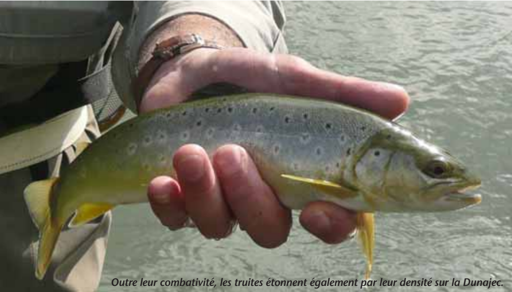
Outre leur combativité, les truites étonnent également par leur densité sur la Dunajec.