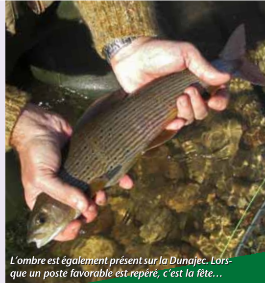
L'ombré est également présent sur la Dunajec. Lorsque un poste favorable est repéré, c'est la fête...

endroits, son lit est parsemé de blocs et de pierres disposés le plus souvent de manière inattendue à tel point que le courant d'une même veine d'eau peut changer trois à quatre fois de direction sur cinq mètres de linéaire. Dois-je vous préciser que le bâton de wading est un allié indispensable sur la Dunajec ? Même équipé de cet accessoire, il convient de progresser prudemment. Pourtant muni de mon bâton, il m'est ainsi arrivé de me retrouver entre des blocs quasi dans la position du grand écart et dans l'impossibilité de faire quoi que se soit. Je m'en suis sorti sans bain mais de justesse... Et comme si cela ne suffisait pas, s'ajoutent à cela les lâchers du barrage de Czorsztyn : le niveau monte, l'eau se teinte davantage - même en l'absence de crue, les eaux de la Dunajec sont très légèrement teintées - et le trajet de retour vers la berge n'en devient que plus compliqué !