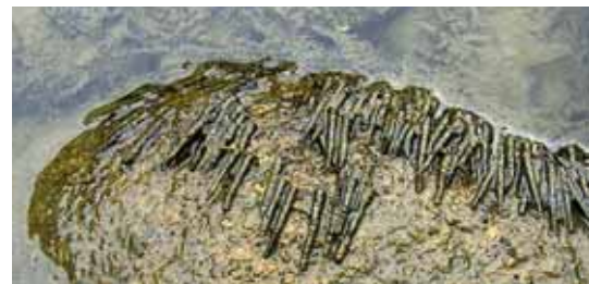
Une photo qui donne une idée des éclosions qui peuvent survenir sur la Dunajec.

Le secteur qui nous intéresse est situé sur la haute Dunajec, non loin de la frontière slovaque, à mi-distance entre Zakopane, la plus importante station de sport d'hiver polonaise (850 m d'altitude) et Nowy Sacz. Le no-kill instauré fin 2007 par la fédération locale s'étend sur 12 km en aval de Kroszcienko n. Dunajcem, une petite bourgade située à 140 km au sud de Cracovie, à l'aval immédiat des gorges splendides que la Dunajec a sculpté au cœur du massif calcaire des Monts Pien-