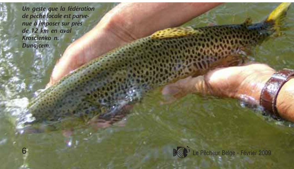
Un geste que la fédération de pêche locale est parvenue à imposer sur près de 12 km en aval Kroszienko n. Dunajcem.

rivière. Pour la pêche en sèche, il convient de privilégier les dérives courtes et précises, davantage efficaces dans les zones chahutées. Sur la Dunajec, point n'est besoin de trop finasser. Dans certains « bouillons », j'ai pris des poissons avec des sèches montées sur hameçon n°10 et 12 et fixées sur une pointe en 18/100 ou en 20/100... Ici, les modèles costauds en cervidé tiennent la dragée haute aux modèles en CDC car ils conviennent mieux aux flots de la Dunajec. Lors de mon dernier voyage sur cette rivière, alors qu'un vent violent rendait nos lancers imprécis, je me suis même essayé au dapping, cette technique qui consiste à utiliser le vent pour soulever soie et bas de ligne et faire